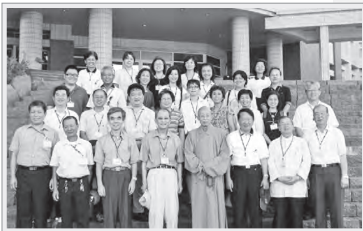
2006年7月29日，慧炬同仁在莊南田董事長帶領下，參訪法鼓山與聖嚴法師合照