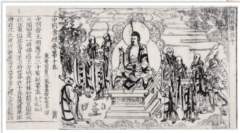
《趙城金藏》中收錄《中阿含經》卷首插圖

彌醯！若比丘自善知識與善知識俱，善知識共和合，當知必行精進，斷惡不善，修諸善法，恒自起意，專一堅固，為諸善本，不捨方便。彌醯！若比丘自善知識與善知識俱，善知識共和合，當知必行智慧，觀興衰法，得如此智，聖慧明達，分別曉了，以正盡苦。彌醯！若比丘自善知識與善知識俱，善知識共和合，當知必修惡露，令斷欲；修慈，令斷恚；修息出息入，令斷亂念；修無常想，令斷我慢。彌醯！