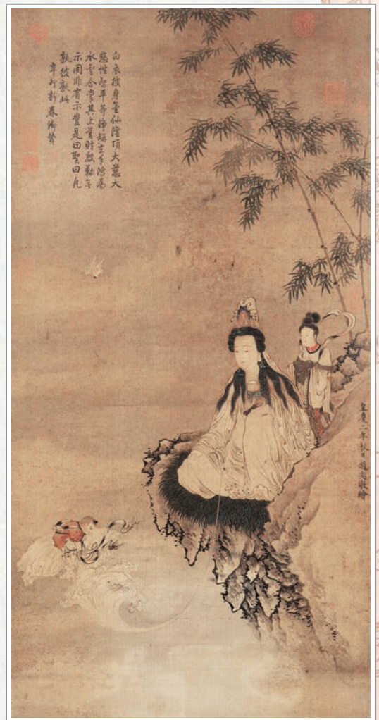
元代「善財童子拜觀音菩薩圖」