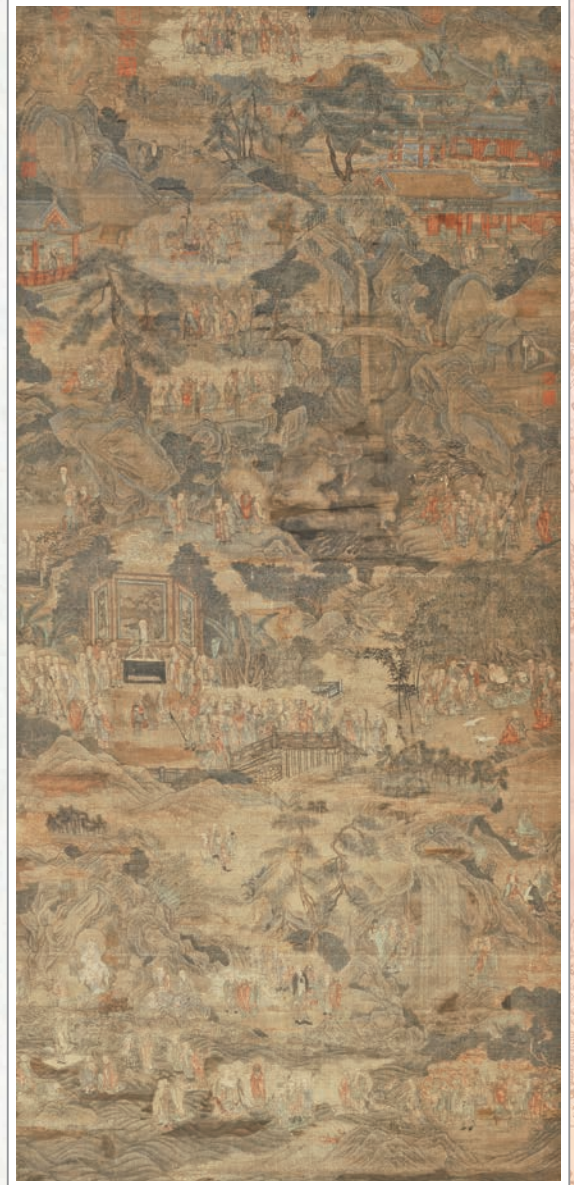
國立故宮博物院典藏之元代「華嚴海會圖」

佛子！菩薩摩訶薩有十種善知識。何等為十？所謂：能令安住菩提心善知識，能令修習善根善知識，能令究竟諸波羅蜜善知識，能令分別解說一切法善知識，能令安住成熟一切眾生善知識，能令具足辯才隨問能答善知識，能令不著一切生死善知識，能令於一切劫行菩薩行心無厭倦善知識，能令安住普賢行善知識，能令深入一切佛智善知識。佛子！是為菩薩摩訶薩十種善知識。