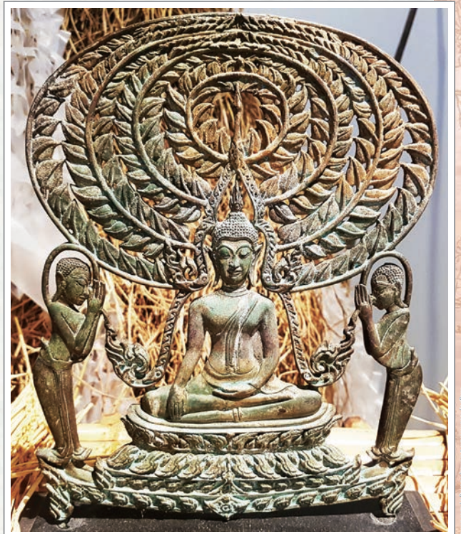
泰國曼谷曼谷藝術文化中心展出農民供奉的釋迦牟尼佛與弟子舍利弗及目犍連尊者金屬雕像，周圍裝飾稻穗和稻草，反映了佛教對泰國人的深遠影響

得阿羅漢。又佛子羅睺羅尊者未證悟前，要求佛陀為他宣說能幫助證得解脫之法，而佛陀觀察其身心尚未成熟，因此未應要求為他宣說進一步的法要，反而要求尊者先去為人演說五陰法、六入法及因緣法等，尊者遵照佛陀的要求，時時為人演說五陰等法，待如此思惟、演說令其身心趨於成熟，佛陀觀察後便為他演說法要，而羅睺羅尊者即依此禪修思惟而得解脫。