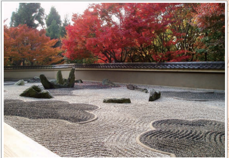
重森三玲設計的京都東福寺龍吟庵方丈西庭