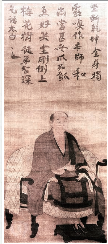
日本鎌倉時代天童如淨禪師畫像

如何答報師恩呢？將所學正法傳承下去是一種方式，學習有成後反過來幫助老師也是一種方式。如鳩摩羅什大師，七歲時跟隨母親一起出家修行，因其聰慧，相傳一日能背誦千偈經文。九歲時，大師與母親到印度闍賓，與盤頭達多論師學習說一切有部的論典與雜藏、阿含經教等，深得其器重贊揚。十三歲時登壇說法，名聞西域，更向莎車太子須利耶蘇摩學習大乘，盡得龍樹菩薩教法，後回龜茲國廣弘佛法，盤頭達多論師聽聞羅什捨說一切有部教法而弘揚大乘，因此來訪，經過一個多月的詰問論義後，盤頭達多反被羅什所說之大乘教法折服，並禮羅什為師，成就「我是和尚小乘師，和尚是我大乘師」這互