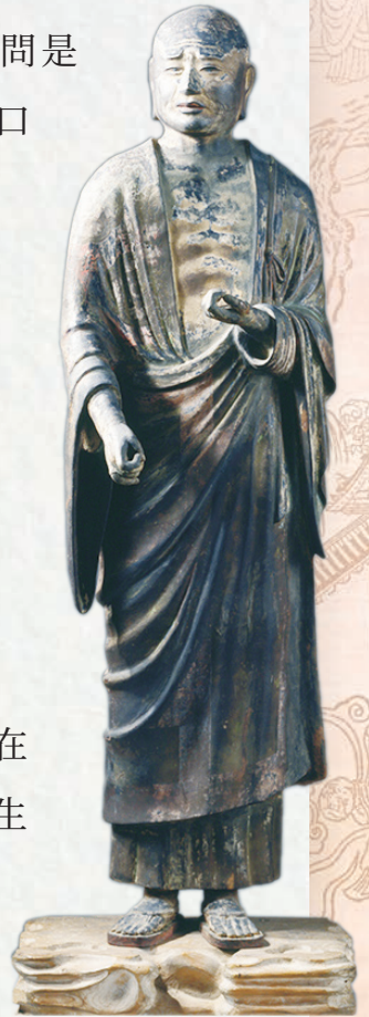
日本國寶8世紀富樓那尊者像 現存於日本奈良市興福寺

密勒日巴師承瑪爾巴譯師，初次面見上師時，恭敬頂禮說：「我是藏地來的一個造了惡業的大罪人，我以身口意都供獻給上師，請上師給我衣食和正法，並請慈悲賜我即身成佛的法門。」瑪爾巴問他造