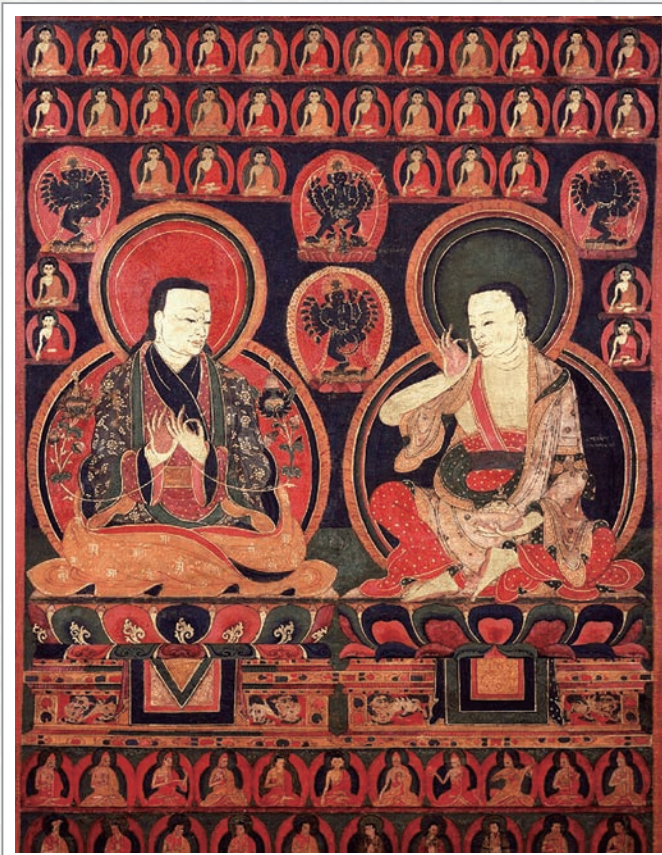
16世紀描繪瑪爾巴(左)和密勒日巴(右)師徒的唐卡佛畫，收藏於美國紐約魯賓藝術博物館

獨自蓋一棟石屋，密勒日巴皆依照上師要求不畏辛苦，那怕背因揸石頭而皮破生瘡，痛苦難熬也努力完成上師的考驗，直到師母祈求瑪爾巴傳授尊者三皈五戒，並講述那諾巴的苦行讓密勒日巴生起信心，誓願「上師的一切話，我都要聽從，一切的苦行，我都要克服。」瑪爾巴要求他再蓋一棟十層樓高的房屋，給予種種的考驗與磨難。最終上師告訴密勒日巴，經過這些磨難苦行，尊者大部份的罪業都已清淨，於是就將殊勝佛法傳給密勒日巴，並加持幫助他修行，且傳戒賜名為「密