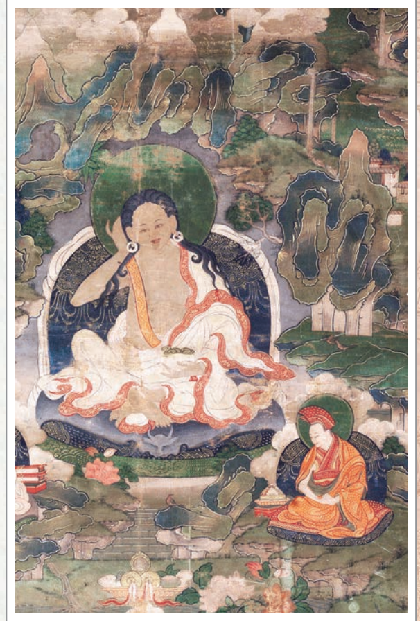
描繪密勒日巴(左)與岡波巴(右)師徒的18世紀唐卡佛畫

這時密勒日巴在橋邊以足置岡波巴頭頂，將四種灌頂全部傳給岡波巴後，本想再傳語詮三昧灌頂，為了鞭策岡波巴精進修行，於是說：「我有一個最深奧的寶貴口訣，但如果傳與別人實在太可惜了。所以，唉，你去吧！」等岡波巴上橋過河行了一小段路後，聽到密勒日巴的呼喚，就立刻回到師父前面，密勒日巴就對他說：「唉！我這個口訣雖然至為寶貴和殊勝，有點捨不得傳人，但是這個口訣如果連你都不傳，還傳給