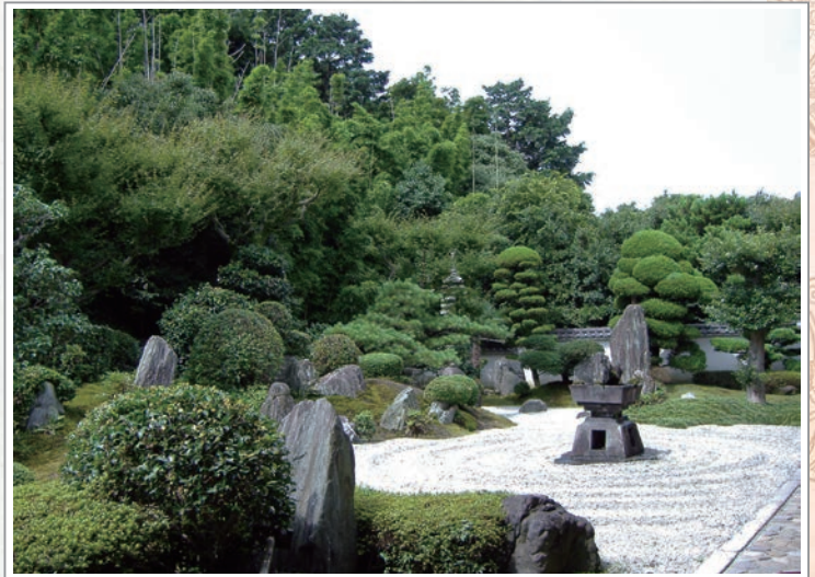
由日本園林造庭大師重森三玲設計的京都東福寺靈雲院九山八海庭園

造庭師則說：有一句話「漲落有時」，一般人都在打算結束某些事時說這句話。其實它的真正意思，反而是強調要把握