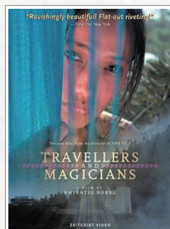
「旅行者與魔術師」 英文版電影海報