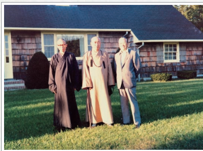
東初老人(中)、聖嚴法師(左)與沈家禎居士(右)合影於紐約長島菩提精舍

這個開頭，讓我們接著看到當時陪在身旁的第一位剃度西方弟子果忍，他們一起經歷法師口中「冬天凍不死，平常餓不死」的出家修行生活，這時候的師徒二者在佛法中陪伴，也開啟了眾人眼中獨特的師徒風光。