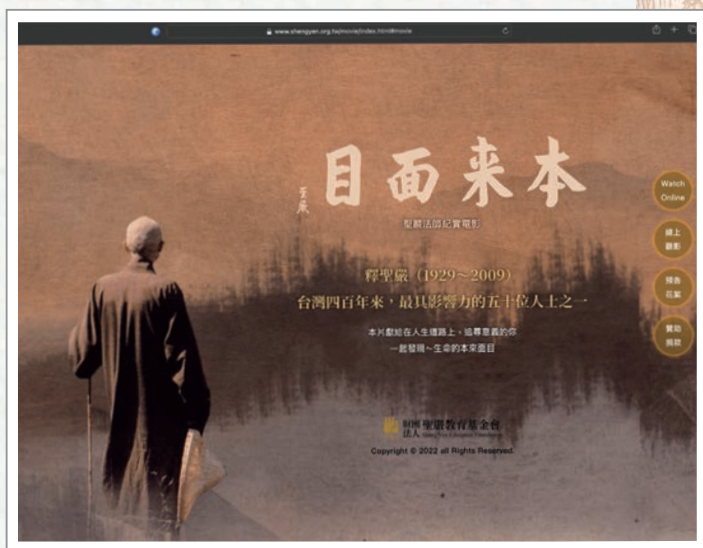
聖嚴教育基金會全球資訊網「本來面目」官方網頁 https://www.shengyen.org.tw/movie/