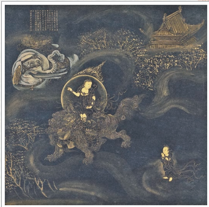
國立故宮博物院典藏之日本僧海嵩畫《善財五十三參》圖冊中的「文殊師利菩薩為善財說」

其中筆者最相應的善知識概念，是《華嚴經》裡的十個譬喻：為慈母、為慈父、為養育守護、為大師、為導師、為良醫、為雪山、為勇將、為牢船、為船師，他們或者扮演支持系統，或者成為療癒者，或者是堅定的守護者，不管以哪一種身分出場，都滋養了被陪伴者的生命，無論是震撼教育，或潛移默化，