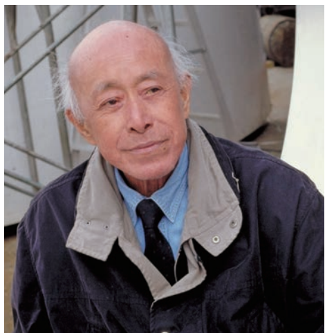
名雕刻家楊英風先生 (引用自楊英風藝術教育基金會)

為了理解上述銅像之風格，本文首先起筆介紹創作者——享譽國際的著名雕刻家楊英風之生平，接著再敘述銅像的特徵。恰逢本期專題所揭櫫的「如法依止善知識」，亦重視世代傳承關係，故也將其繼承人——寬謙法師，承襲佛教藝術的創作，稍作陳述，以為結語。