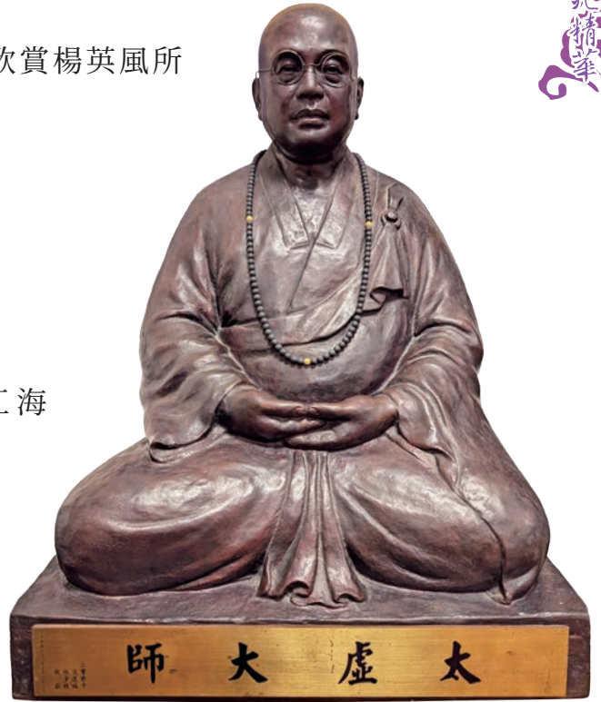
楊英風雕鑄創作太虛大師法相

太虛大師（1890-1947）生於浙江海寧，自幼喪父，因母親改適，由外祖母及二舅撫養成人。大師剃度出家，法名唯心，後於曹洞宗下受戒，法名太虛。師從多位高僧，深研《法華經》、《楞嚴經》等經典，並涉獵禪學要典。