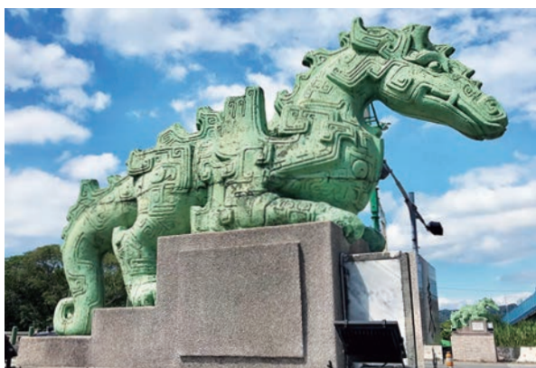
台中東勢大橋「飛龍」