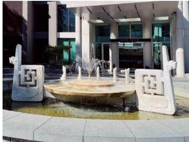
南投日月潭教師會館前水池上的「鳳凰噴泉」

1962 年後，楊英風接受了許多公共景觀雕塑的委任創作，包括台中教師會館「梅花鹿」、台中東勢