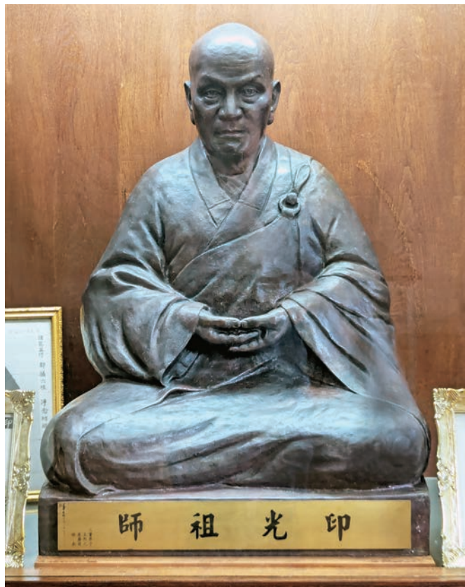
慧炬印光祖師紀念堂內供奉由楊英風所雕鑄的印光祖師法相

本尊法像呈跏趺坐姿。計高68公分，寬40公分，深25公分。頂上亮光無髮，額下雙眉隆起，雙眼瞠目，鼻側顴骨隆起，兩耳緊貼鬢邊，嘴唇緊抿，下巴微凸。身軀內著交領右衽袍服，外披水田袈裟，左肩下