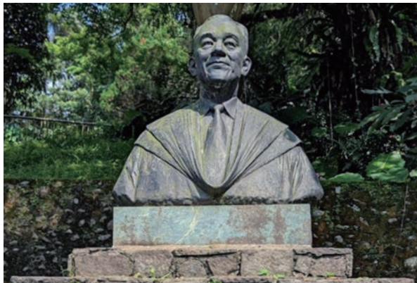
南港胡適公園雕塑「胡適之像」

1966年返台後，其趕往花蓮為大理石工廠創作了一座大門景觀雕塑，題曰「昇華」。此作品高約9公尺，十分壯偉，有一種向上飛騰放射的動態。其後又創作了「太魯閣山水系列」，是山水雕塑的一個巨大突破與成就。又為花蓮航空站規劃大型浮雕「太空行」，及