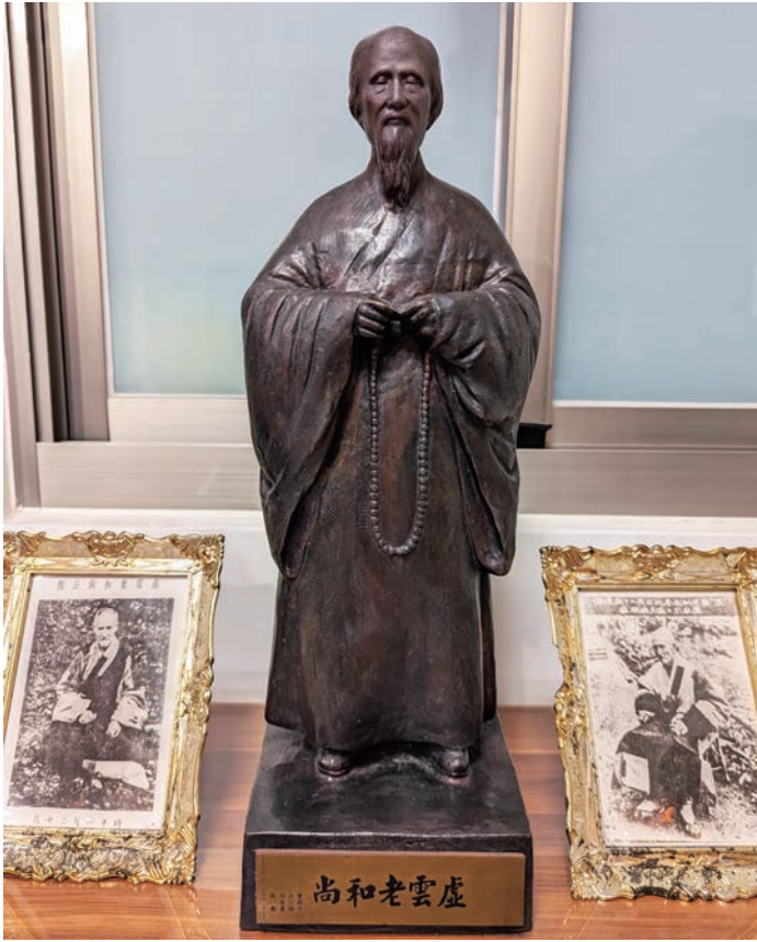
楊英風雕鑄創作虛雲老和尚法相

1920年重興雲棲寺，歷任福建、廣東諸大寺之住持。1951年，適值中國展開「鎮反運動」，老和尚遭誣陷拷打，仍堅定信仰。1959年10月13日，老和尚圓寂於雲居山。