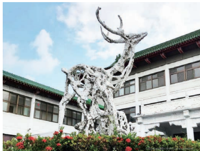
台中教師會館「梅花鹿」