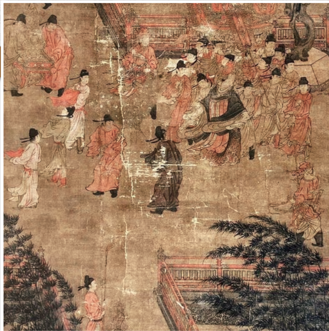
唐代張萱〈唐后行從圖〉描繪武則天出行（局部）

西元690年10月16日，武后在神都洛陽則天門登基即位，改元天授，加尊號「聖神皇帝」，成為中國傳統正史上唯一