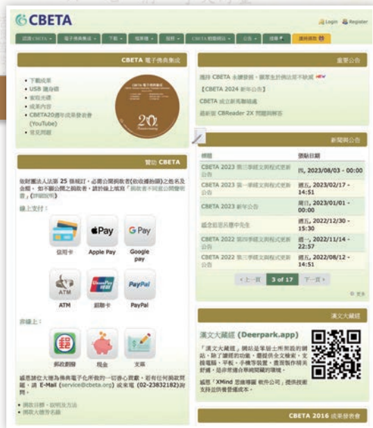
財團法人佛教電子佛典基金會CBETA官方網站 https://www.cbeta.org/

佛教電子佛典基金會旨在收集所有的漢文佛典，以建立電子佛典集成；研發佛典數位化技術，以提昇佛典交流與應用層面。利用電子媒體之特性，