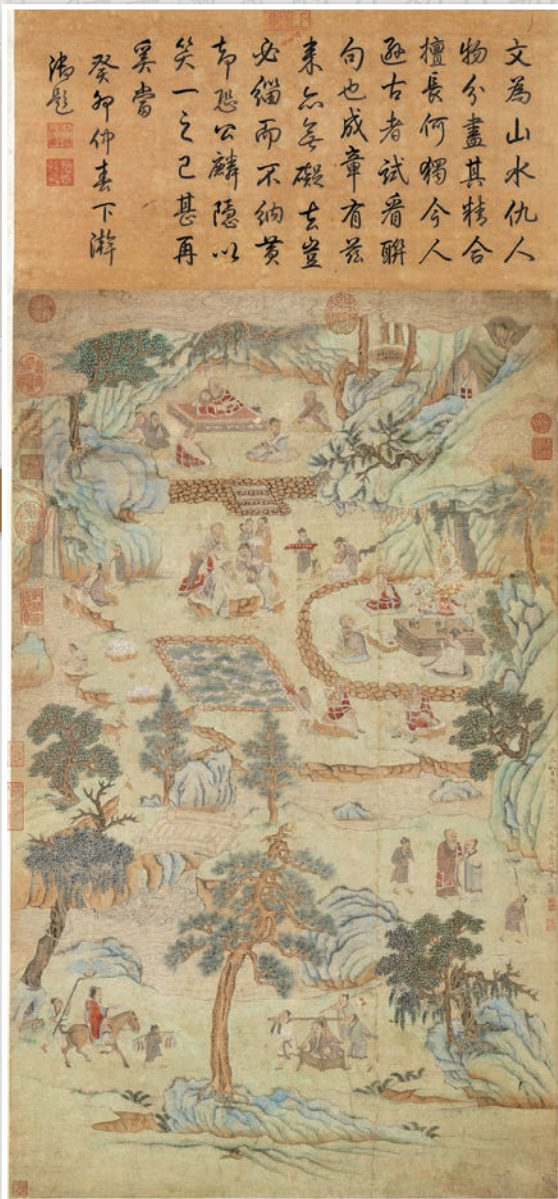
明代文徵明、仇英合摹李公麟「蓮社圖」，描繪淨土宗初祖慧遠禪師等在廬山白蓮池畔結社故事，可見當時佛教發展興盛，現收藏於國立故宮博物院

南朝是漢傳佛教迅速發展的時期，由於譯經事業隆盛，也促成教派成立而逐漸脫離過往依附儒道的型態。南朝帝王多喜問道，在延請僧人佐政的風氣中，佛教地位得到明顯提升。宋文帝邀請慧琳議論國事，世稱「黑衣宰相」；宋孝武帝問法於印度譯師求那跋陀羅；齊文宣王廣召名僧如僧祐、寶誌講經解義，造經唄新聲；梁武帝更親自登壇說法、建