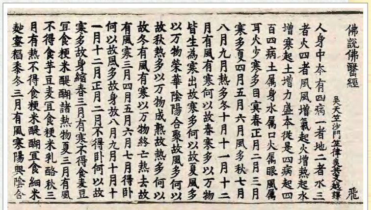
《佛說佛醫經》高麗藏本（局部）

「好肚腸一條，慈悲心一片，溫柔半兩，道理三分，信行要緊，中直一塊，孝順十分，老實一箇，陰鷲全用，方便不拘多少。」