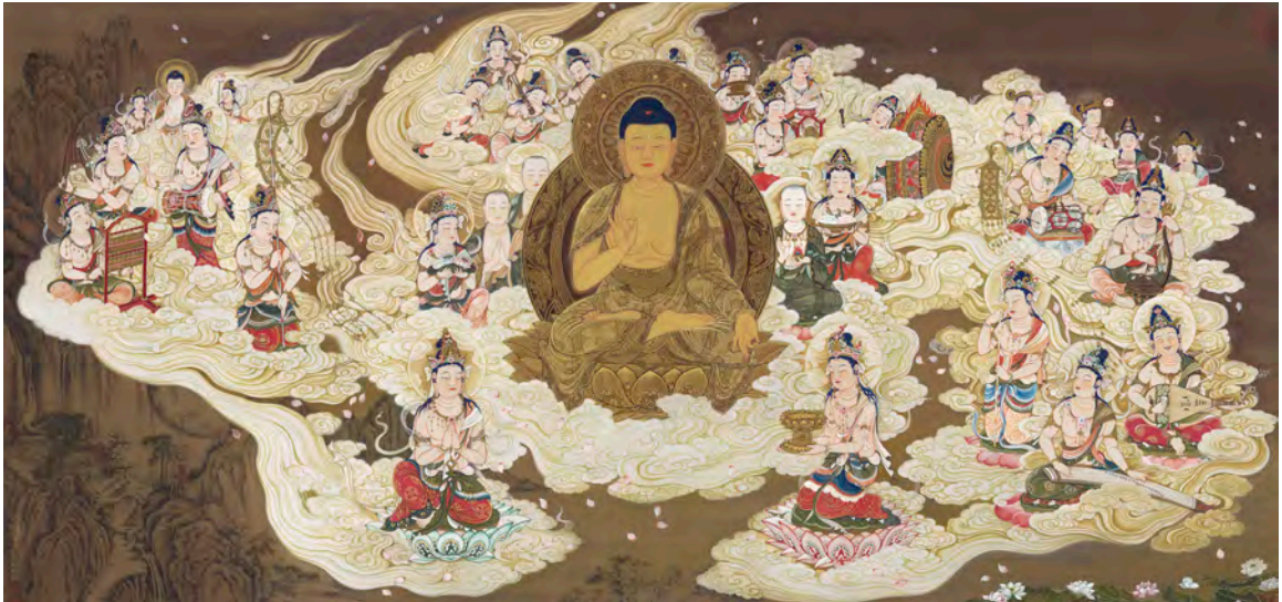
阿彌陀佛二十五菩薩聖眾來迎圖

至於〈藥師琉璃光如來圖〉，以墨綠色為底，畫幅正中主尊藥師佛以大紅袍服披掛全身，頂上淡紅色頭光，底座為多層蓮花。下端左右兩側為脇侍日光、月光菩薩，菩薩外側為十二藥叉大將，上端八大技樂天人分兩組浮在白雲上。尊像布局左右對稱，十分端正。