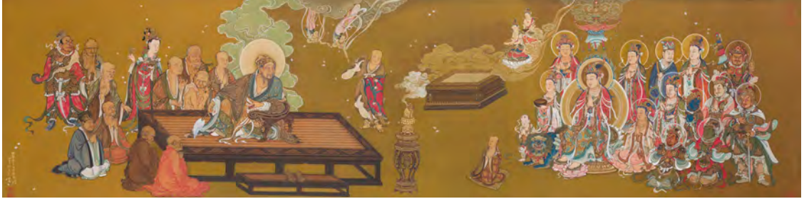
維摩詰大士演教圖

至於維摩詰居士圖像的形成，自東晉顧愷之創作了「清羸示病之容，隱几忘言之狀」的形象後，歷代畫師相繼仿效，成為常見題材之一。但傳至後世，維摩居士已不帶病容，更演變成氣勢軒昂的大辯士，且畫幅中必與文殊菩薩左右對面，四周圍著許多聽眾。