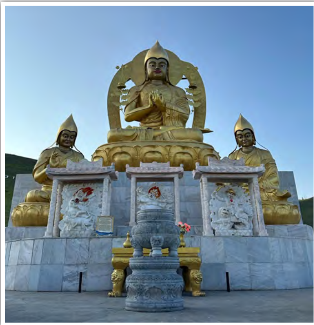
慶寧寺附近父子三尊像