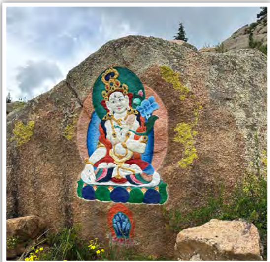
福祈寺址附近白度母岩畫

往山上走可以見到幾處岩畫，如度母與宗喀巴大師像等，推測應是1990年代民主化後繪製的。坡道上也可見後來移置於此地的草原石人，據悉他們製於六世紀的突厥時期，屬於貴族葬儀的一部分。