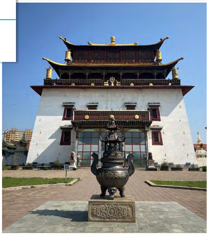
蒙古最大寺甘丹寺大殿前

政治影響力，多邀請藏傳佛教格魯派喇嘛前來傳教。清代實行政教合作的政策，支持並拉攏蒙古格魯派勢力，以穩固對蒙古的統治，更讓佛教勢力如日中天。甘丹寺（建於1838年，得名於拉薩甘丹寺）就是在此歷史背景下成為蒙古最大的寺院與政教中心。後到1930年代蒙古人民黨發動「大鎮壓」，國內所有寺院不是遭到摧毀就是被迫關閉，這個情況一直要到1990年代民主化後