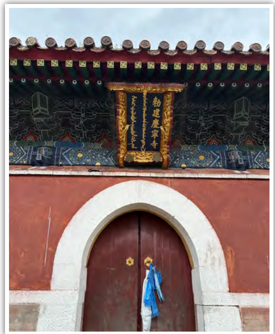
雍正年間敕建慶寧寺（匾額有漢滿蒙三文，建築風格亦為漢滿蒙之融合）