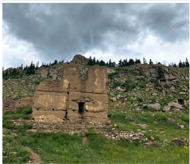
福祈寺大殿原址一景