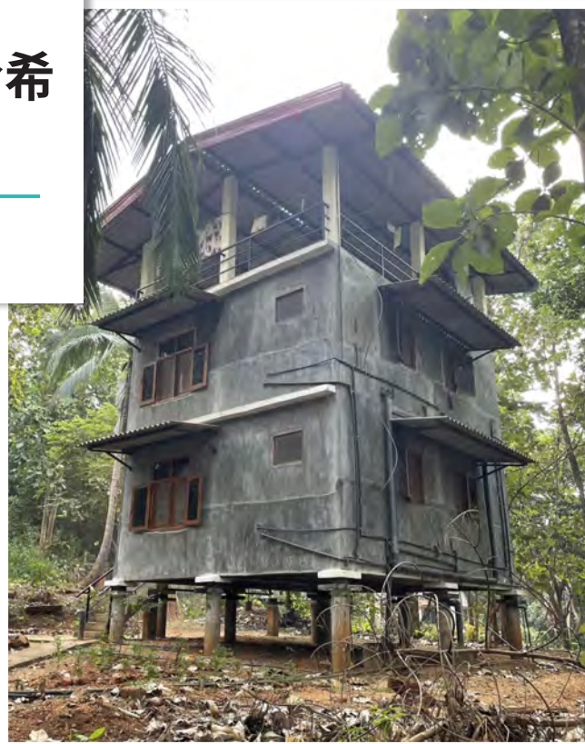
筆者禪修期間所居住的「孤邸（kuti）」

龍樹林座落在果園與熱帶叢林裡，每位禪修者獨居一棟孤邸（Kuti），每日除早、午餐與一週三次的開示時間之外，其餘時間任禪