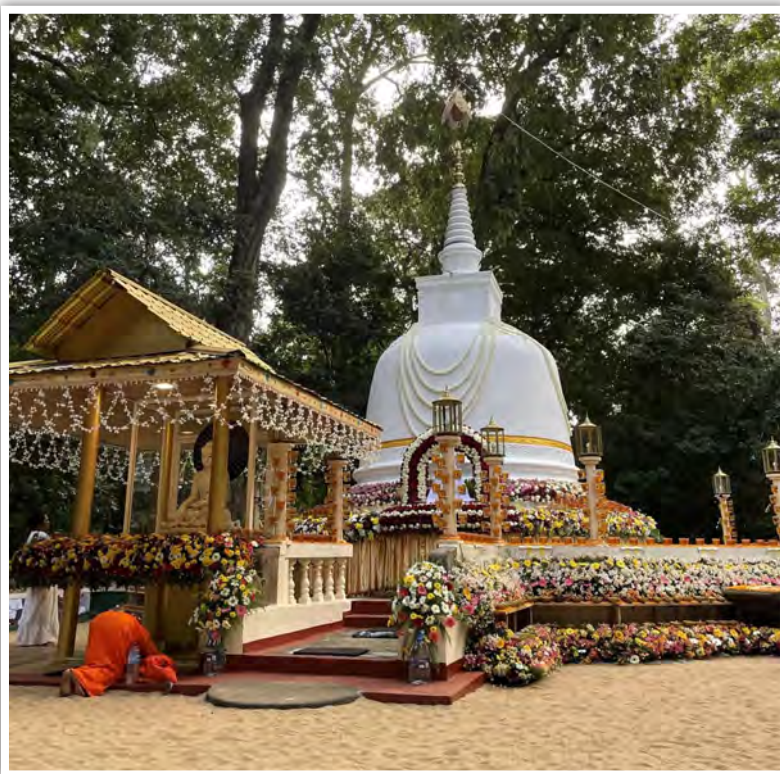
慶祝長老生日時以各種天然花裝飾佛塔

過往，在我求學、工作的過程中，都是因期待有更好的成績、更好的發展而有動力前進，如果不去期待，禪修究竟怎麼進步？某次禪坐時，我糾結於這矛盾，但突然，我意識到這糾結也不過只是一種念頭，我用觀照呼吸、觀照疼痛的方式，去觀察糾結的情緒，接著這種不間斷的念頭，便慢慢的減去了。向禪師報告這一體驗時，禪師說，我的禪修開始進步了。