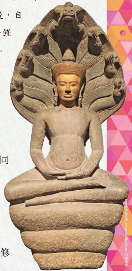
13世紀龍王護法坐佛像 泰國曼谷國家博物館典藏

總之，不論故事真相為何，佛陀的成道，鼓舞、感動了畜生道的眾生，眾生皆能成佛，畜生道的眾生也想修行，成就正果，脫離輪迴的苦海。🌀