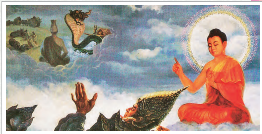
描繪佛陀度化龍王的佛本生故事畫

前述提到的「目真隣陀」、「牟枝隣陀」或「目支鄰陀」是音譯，梵文皆是 Mucilinda，巴利文則稱為 Mucalinda，意