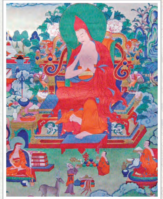
19世紀「無著菩薩」唐卡(局部)

佛陀所說戒律的內容非常龐大，學戒不是那麼容易，甚至可以說是困難的。但是透過釋迦光、功德光二位尊者的解釋去學戒，會讓人有「怎麼會學不會呢」的感嘆。龍樹菩薩、聖天菩薩解釋了中觀方面。無著菩薩、世親菩薩解釋了現觀及俱舍。陳那論師、法稱論師解釋了量論。