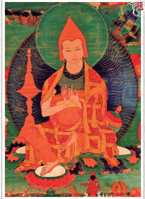
建立噶當派的阿底峽尊者，18世紀唐卡(局部) 典藏於美國魯賓藝術博物館

我們一直努力學習五部大論，卻不把它當作是最重要的修行，總覺得有另外的修行方式，這個不適合自己。常常遇到有人跟我說：「我年紀大了，想找個念佛的法門。或有沒有其他的修行方式？」噶當派也好、宗喀巴大師父子也好，早就找到最殊勝且圓滿的修行方式。到現在還要左碰右撞去找修行方式，這是件不太好的事情。因為我常常遇到這種事，所以想特別提一下。