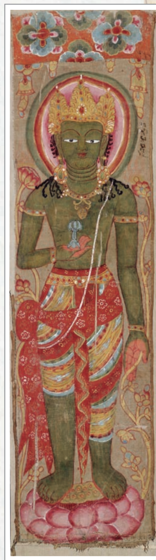
敦煌出土9世紀金剛手菩薩像 現藏於大英博物館

在八萬四千煩惱病中，單是貪或是瞋等任何一種煩惱，就能將南瞻部洲所有的人都毀滅、拋擲到惡道，