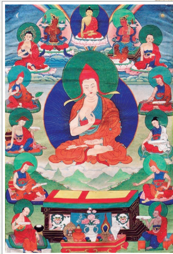
描繪寂天菩薩宣說《入菩薩行論》的唐卡

安住於東南西北等十方無量無邊世界中，二利究竟圓滿的世尊佛陀，以及心具無緣大悲的佛陀心子中，主要的十地菩薩，及資糧道、加行道等的一切菩薩眾們，我身恭敬地雙手合掌，語恭敬地祈請。