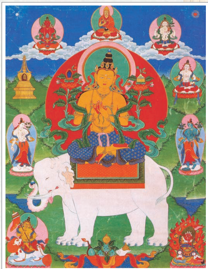
19世紀普賢菩薩唐卡

初學菩薩懺罪最殊勝對象，大悲體性的聖虛空藏菩薩，和用大地精華滿足利益三界眾生的地藏王菩薩，以及對三界眾生有無緣大悲，是眾生怙主的彌勒菩薩、除蓋障菩薩等一切菩薩，祈求您們救拔輪迴中總、別的一