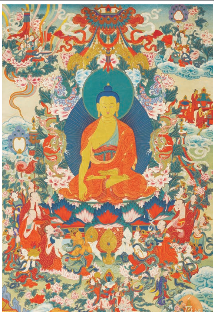
19世紀釋迦牟尼佛唐卡

如此說來，要醫治這些惡疾，就必須依照遍知的佛陀醫王所開的藥，依著能根除貪等一切煩惱病痛的八萬四千法去做、去取捨，如果不這樣做，而想依其他方法的人，就太愚癡了，應被智者們斥責。