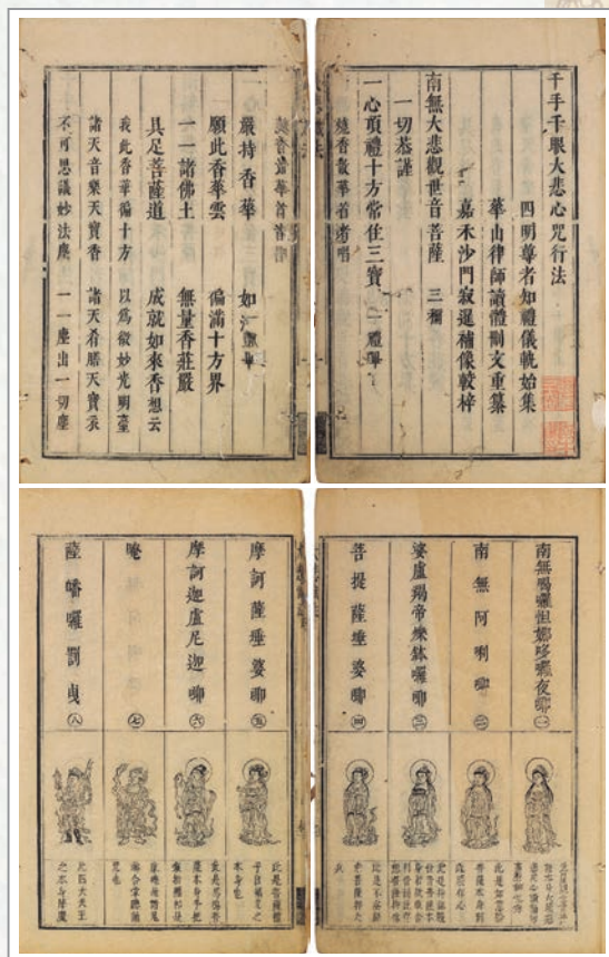
清代印行《千手眼大悲心咒行法》書冊中的部分頁面，收藏於日本東京大學綜合圖書館

《法華三昧懺儀》首重「勸修」，其核心在於確立修行者對「一乘實相」的堅定信心。此單元以「起信」為要旨，強調眾生本具佛性，與佛陀無二無別的清淨本質，此乃大乘佛法修學之根本前提。信為道源功德母，能破無明疑網 10 ，令行者確信：一者自