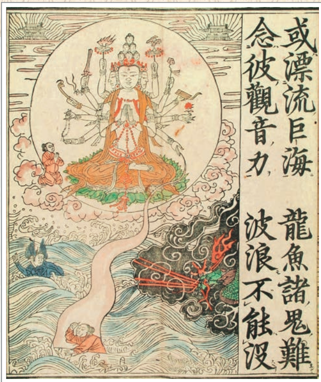
1660年日本重刻彩印《妙法蓮華經觀世音菩薩普門品》書冊中描繪「觀世音菩薩救水難」插圖

《法華三昧懺儀》為天台宗開宗祖師智顛大師所編撰 ⑥ ，其修持核心即「法華三昧」——圓融止觀之實踐法門。《隋天台智