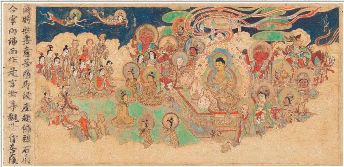
13世紀日本《妙法蓮華經》彩繪經卷中的插畫，收藏於美國大都會藝術博物館