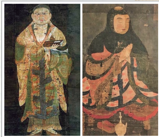
日本國寶11世紀「聖德太子及天台高僧像」中的慧思禪師像（左）、智顗大師像（右），現藏於日本兵庫縣一乘寺

如同運動須熱身、考試須準備，修懺前必須先做好身心準備。智顗相當重視前方便，內容包含調伏其心、息諸緣事、供養三寶、一心繫念等 13 。這與默照禪調心四階段中的前三階段（收心、攝心、安心） 14 三階相通，皆屬修行入門之必備準備，為進入正修鋪路。