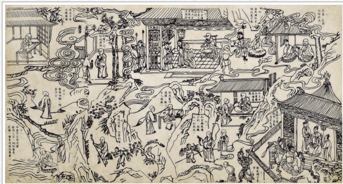
《慈悲三昧水懺》卷前「水懺緣起圖」

好不容易來到西蜀，天色將暗，山路既崎嶇又難行，正在徬徨不知所措時，忽然看到了兩棵並立的松樹直入雲霄，心中大喜，知道昔日相約之事並非虛假，迅即趨前走去。只見高樓廣殿，金碧輝煌，那位僧人已站立