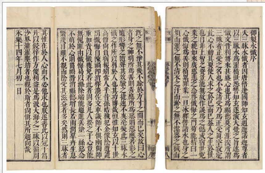
明代萬曆版《嘉興藏》收錄之〈御製水懺序〉，東京大學綜合圖書館典藏

承上所述，我們此生因過去業力投生於此娑婆世間，又耽染三毒習性，舉心動念多為罪業。懺云：「凡夫愚行，無明闇覆，何人無罪？何者無愆？吾人當念：人命無常，喻如轉燭，一息不來，便成灰壤，三塗苦報，即身應受。」禮懺功德無量無邊！古德曾說：「念佛一句，福增無量；禮佛一拜，罪滅河沙！」滔天大惡，擋不住一「悔」字。所以應及早趁此禮懺，滅罪植福！