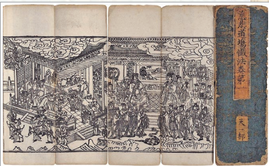
俗稱《梁皇寶懺》的《慈悲道場懺法》

當這種罪業開始干擾我們的生命，讓我們覺得障礙、痛苦的時候，就必須要修「懺悔法門」來破除障礙，讓身心恢復健康，以繼續修學佛法。所以，懺悔法門在佛教中被視為修行的基礎，不管修學念佛法門、止觀法門……或者修種種的密法，在修道之前，都必須透過反省、懺悔來破障；這就像你今天要開車出門，雖然你有非常好的車子，但是要上路之前，還得排除路上的崩山、落石等，障礙清理乾淨，這車子才能順暢抵達目的地。所以「懺悔法門」就是在邁向菩提之前，先把修道中的障礙搬開，它就是扮演這種「破除障礙」的角色。