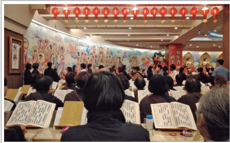
大悲懺法會

洗除過去、現在所積種種障垢，從而獲得生命的解脫！禮懺可以洗滌罪垢，雖是各個懺法共有功效，但水懺特以三昧法水，洗去宿世怨仇垢心，這是本懺法的特色。