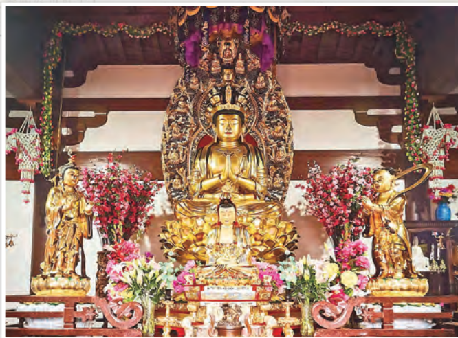
普陀山不肯去觀音內供奉的十一面觀音像

峨眉山是普賢菩薩道場，位在四川省峨眉山市，有「震旦第一山」之稱。《峨眉山志》記載，漢明帝年間有一位名叫蒲公的老人入山採藥，途中發現麋鹿的足跡，形狀宛如蓮花，覺得異常神奇，便循著足跡一路登上山頂。就在山巔之處，他親見普賢菩薩莊嚴示現，光明遍照，祥瑞殊勝。老人深受感動，認定此乃聖跡，自此虔心侍奉普賢菩薩，將峨眉山視為菩薩顯聖的道場。