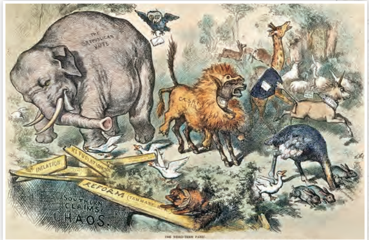
1874年11月7日《哈波週報》所刊載的「驢子披著獅子皮在動物園裡嚇唬其他動物」的政治諷刺漫畫（後期彩繪上色）

在此引出與讀者分享，從佛法角度來解讀，是外表不能代替內涵，真正的力量與尊嚴，來自心靈與品德，而不是虛假的裝飾。虛假也終將暴露，不論是言語還是行為，都會顯現出一個人的真實本質。至於修行則貴在真實，吾人修的是內心的清淨與智慧，而非追求外在的虛名。🌀