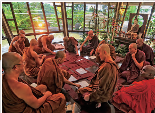
合力裁製「卡提那衣」的南傳僧眾

盛行於南傳佛教國家，每年雨季過後的一場盛大慶典「卡提那節」。這不是一般的節日，它背後藏著佛陀時代的故事與慈悲智慧。