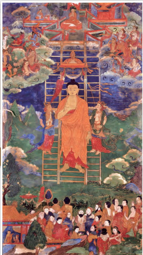
18世紀蒙古地區描繪「佛陀天降」的佛本生故事彩畫

7日之後，佛陀沿著諸天所建的天梯徐徐而下，帝釋天與諸天聖眾環繞左右，舉寶蓋、立法幢，恭敬護送。光明普照三千世界，祥瑞盈滿虛空，這一天被尊為「佛陀天降日」。