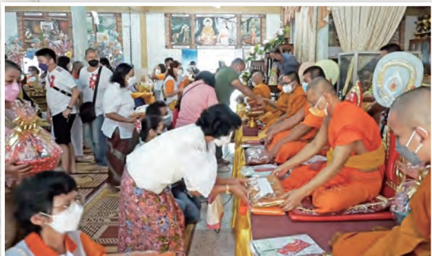
卡提那節法會中，信眾恭敬心供養僧團

卡提那衣不只是一件「衣服」，它還蘊含了四層意義：1. 強化僧團的團結與合作；2. 讓僧人彼此照顧、互相關懷；3. 引導在家信眾起尊敬與護持之心；4. 護持僧團，也就是為自己種下福田，獲得堅固的福報。因而卡提那衣又叫功德衣、堅實衣。因為它象徵著僧俗兩方共同完成的一份「堅固福德」。