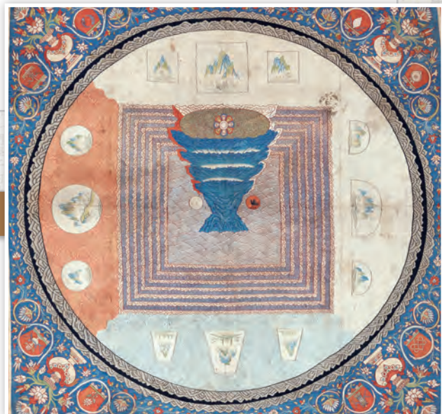
收藏於美國大都會藝術博物館的14世紀緹絲編織曼陀羅圖，畫面中央即為須彌山

經過兩千多年的流轉，卡提那節不僅沒有消失，反而成為佛教最重要的慶典之一。它提醒我們：佛教之所以能傳承至今，是因為僧團堅持修持，信眾不斷護持，彼此之間形成一種互為依靠的善緣。這也正是佛陀最欣慰的畫面：兩安居時，僧團安住一處，和合清淨；安居結束後，僧俗共慶，共同護持，法脈延續。因此卡提那節又被稱為佛歡喜日、僧寶節。