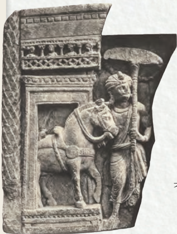
白馬犍陟與車匿的古石 雕照片，為1897年英屬印 度時期的考古紀錄

值此丙午馬年之際，整理佛教史上著名、有功的白馬故事，祈願您馬年行大運，慧馬奔騰，馬到成功。