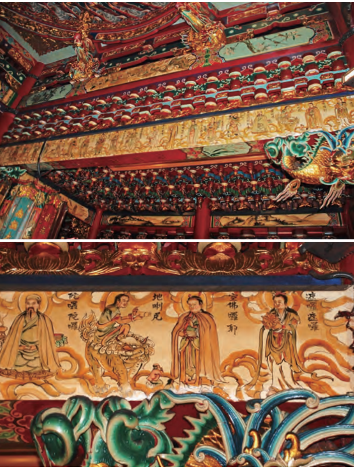
圖一之1&2：台北艋舺龍山寺主殿圓通寶殿內的彩繪

中土漢地的流傳，早期從唐代譯師伽梵達摩所譯出的《千手千眼觀世音菩薩廣大圓滿無礙大悲心陀羅尼經》（簡稱《千手經》）開始。本經由「經」和「咒」所組成，「經」的部分主要說明誦咒之功德，「咒」的部分則為「八十四句」祕密咒語。