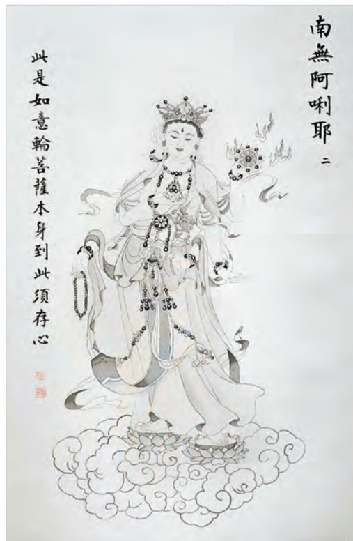
圖二之2：南無阿唎耶

首幅畫幅即稱「南無喝囉怛那哆囉夜耶」，以楷書題於畫幅的右側上端行列，此即〈大悲咒〉首句，譯義為：「皈命禮敬十方無盡三寶」。畫幅左側再以楷書題曰：「此是觀世音菩薩本身大須慈悲用心誦讀勿高聲神性急」。孫畫師以細線勾勒的筆法畫出立姿觀世音相，承傳統白衣觀音造型，頭上髮頂披戴頭巾，垂及兩肩下，在微側身中，胸前飾瓔珞，兩臂著寬袖袍服，左手掌伸出前方，握住一串佛珠，下半身長裙圍繞，皺褶隨風飄起，裙下雙足隱沒於朵朵團雲中，動感十足。（圖二之1）