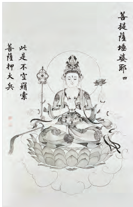
圖二之4：菩提薩埵婆耶