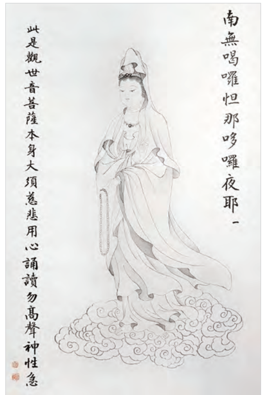
圖二之1：南無喝囉怛那哆囉夜耶 圖二觀音圖皆孫淑英攝影