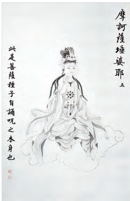
圖二之5：摩訶薩埵婆耶

第八幅畫幅右端題曰：「薩皤囉罰曳」，譯義為：「自在聖尊」。畫幅左端題曰：「此四大天王之本身降魔」。尊像承襲傳統護法天王造型，顏面鬍鬚滿腮，全身上下盔甲鋼胄護身，左手握長槍，右手上舉寶塔，一