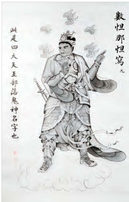
圖二之9：數怛那怛寫