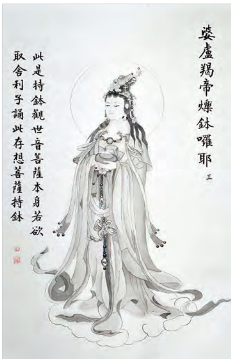
圖二之3：婆盧羯帝爍鉢囉耶