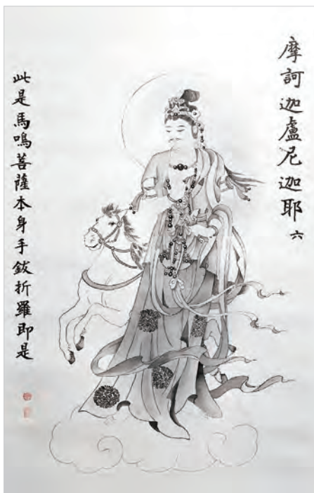
圖二之6：摩訶迦盧尼迦耶