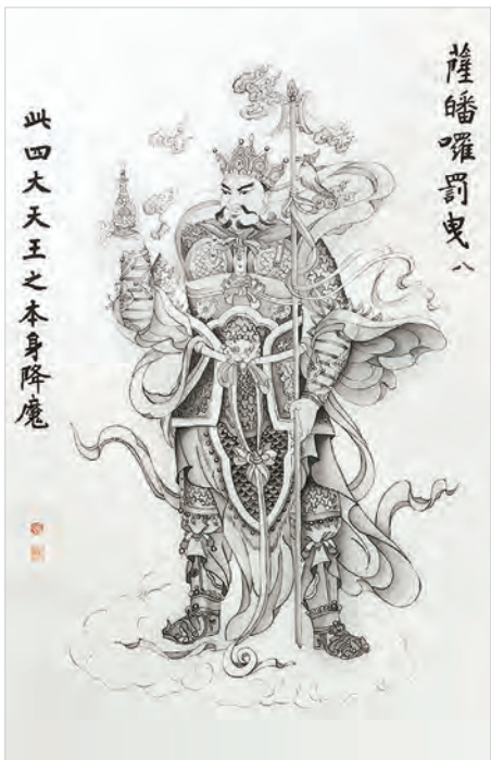
圖二之8：薩皤囉罰曳

其中呈現完整佛尊造型者為數較少，例如第三十五幅「穆帝隸」(圖二之10)，畫幅左側題曰：「此是諸佛合掌聽誦真言」，以跏趺於仰蓮寶座上的佛尊為主軸，上端為雙層、流蘇下垂的寬闊華蓋，尊像頭後純白正圓光可鑑人，身後兩圈身光文飾華麗。佛頂肉髻突起，兩眼垂視，身披天衣，雙手合十於胸前，全身彰顯著佛法的總綱「戒定慧」三無漏學，十分莊重。