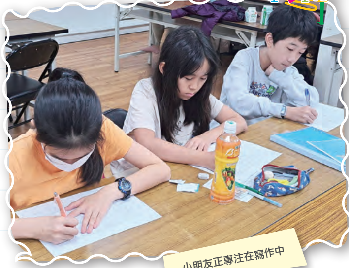
小朋友正專注在寫作中

「冬至」這個節氣，充分展現東方的哲學智慧。一方面是冬季的極致，是黑夜最長的一天；同時也代表度過冬至後的一線光明，將拉展開日漸增益的溫暖。於是我們透過「冬至大過年」以及「冬至一陽生」兩句話，帶著孩子們一起體會其中的意蘊。