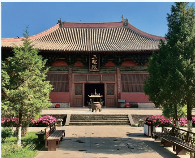
三聖殿——大殿前簷呈弧形的遼金建築

三聖殿內有四塊碑，其中一塊是「大金西京大普恩寺重修大殿記」，在金世宗大定 16 年（1176 年）八月