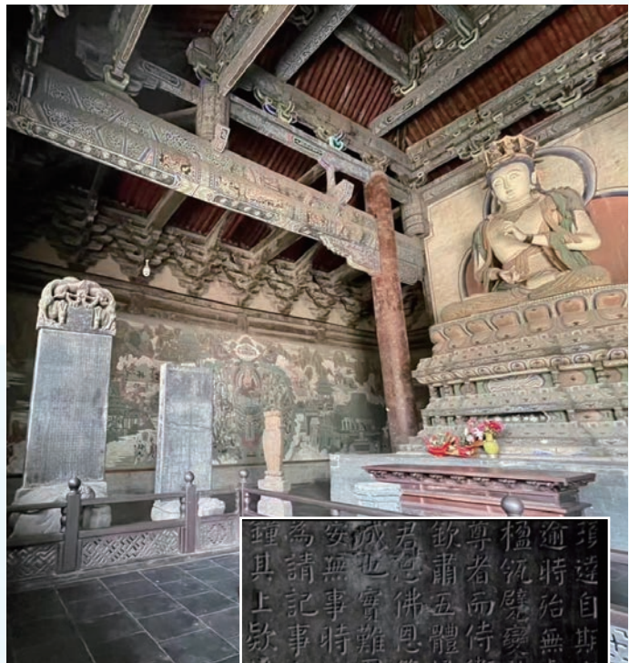
三聖殿角落中的兩通名碑