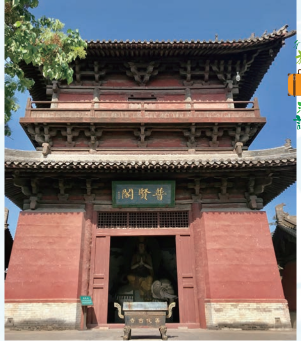
善化寺伽藍七堂之一的普賢閣

善化寺的前身是在遼代大修而成的大普恩寺。遼代是契丹人在西元 907-1125 年間在中國北方建立的國家，國祚雖然只有 219 年，在三千年有文字記載的中國歷史中佔不到什麼大份量，但是因為當時契丹很強大，因此當時契丹的名稱就代表了中國，直到現今這樣的稱呼都還存在，現今俄文的中國仍然是「契丹」的讀音。後來的蒙古人稱中國的北方為契丹，