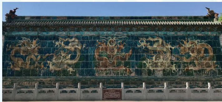
興國寺搬來的五龍影壁

遼太宗是後世給他上的廟號。耶律德光後來學習了漢人的典章制度，在西元 947 年把國號改為大遼，年號為神冊，成了遼國的第一位皇帝。而同時期的後晉高祖就是石敬瑭，歷史上出了名的兒皇帝，為了當皇帝不擇手段，對耶律德光執父子禮，還附帶割讓了燕雲十六州，引遼兵打敗後唐，自己當上了後晉的開國皇帝。不過軟骨頭的後晉沒撐多久就被契丹滅了，從西元 936 年到 947 年，一共十二年，兩